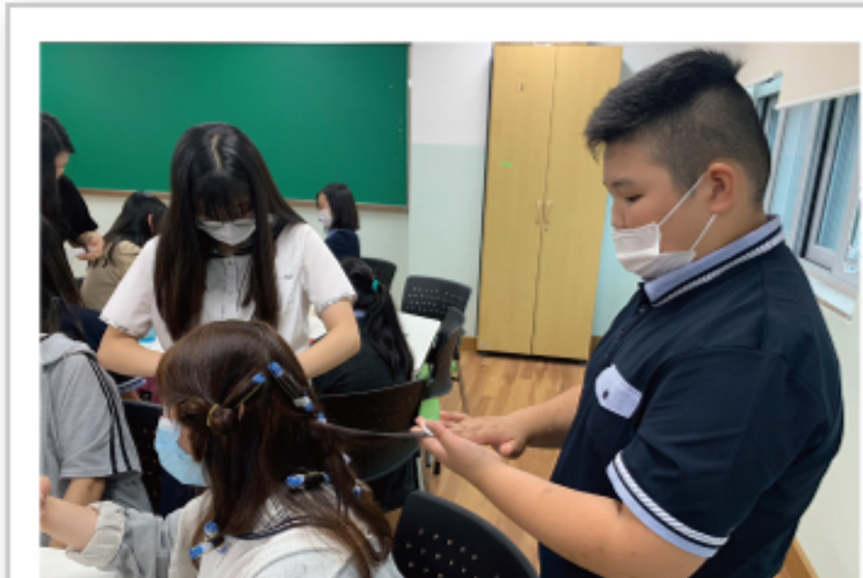
직업체험교실 - 헤어디자이너