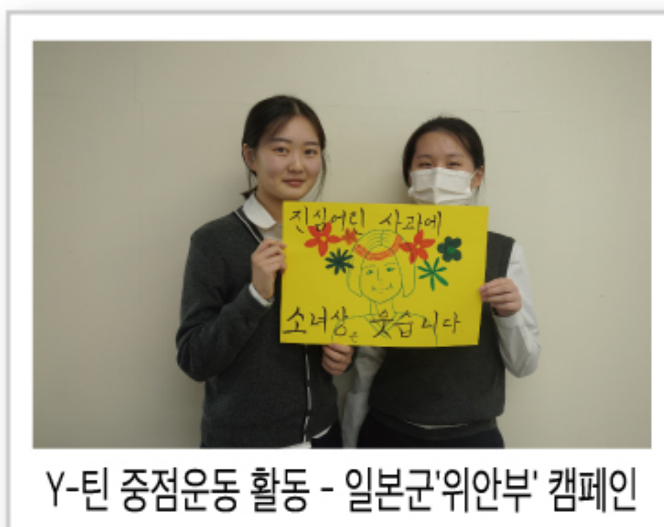
Y-틴 중점운동 활동 - 일본군'위안부' 캠페인