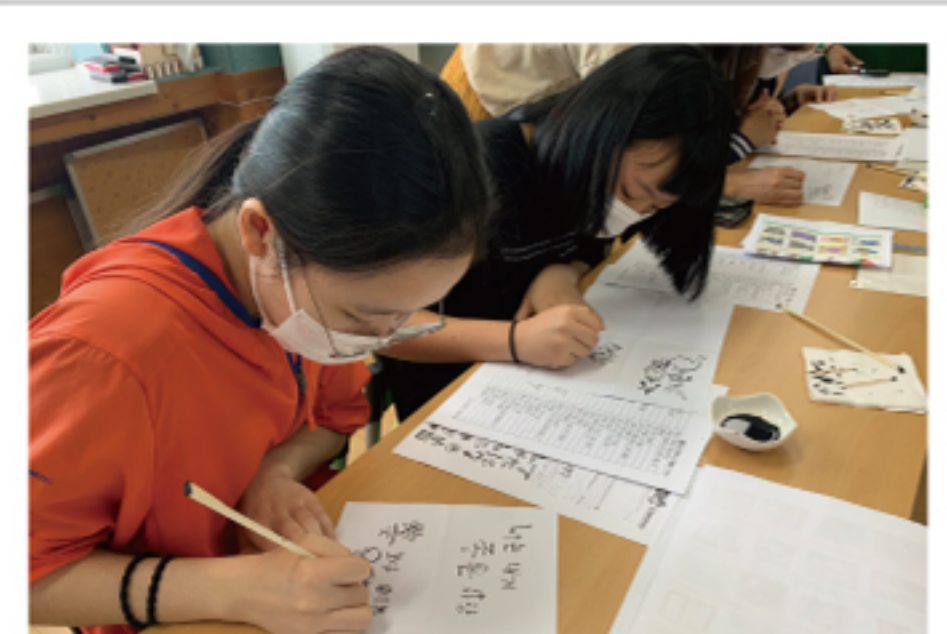
직업체험교실 - 캘리그래퍼