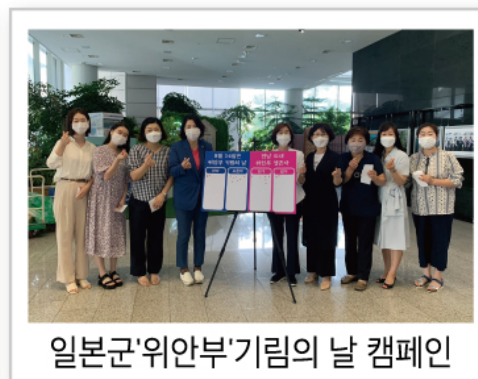
일본군'위안부'기림의 날 캠페인