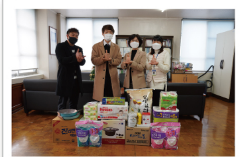
산모, 제공인력 후원물품 전달