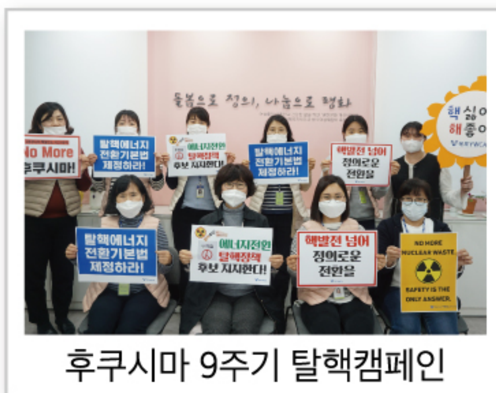
후쿠시마 9주기 탈핵캠페인