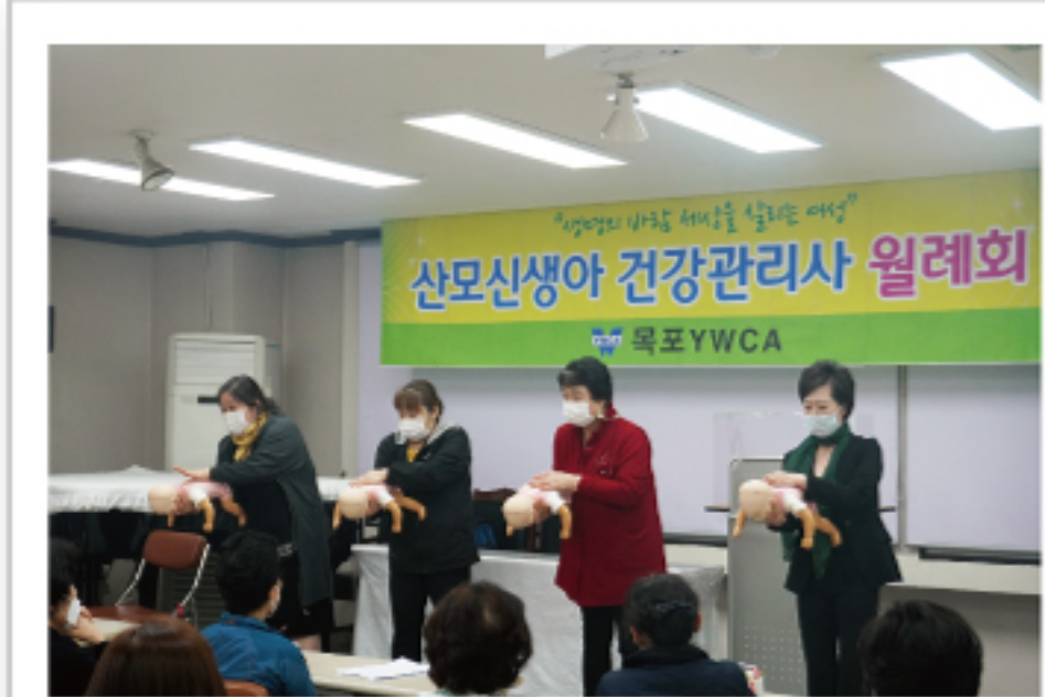
산모신생아 건강관리사 안전관리교육