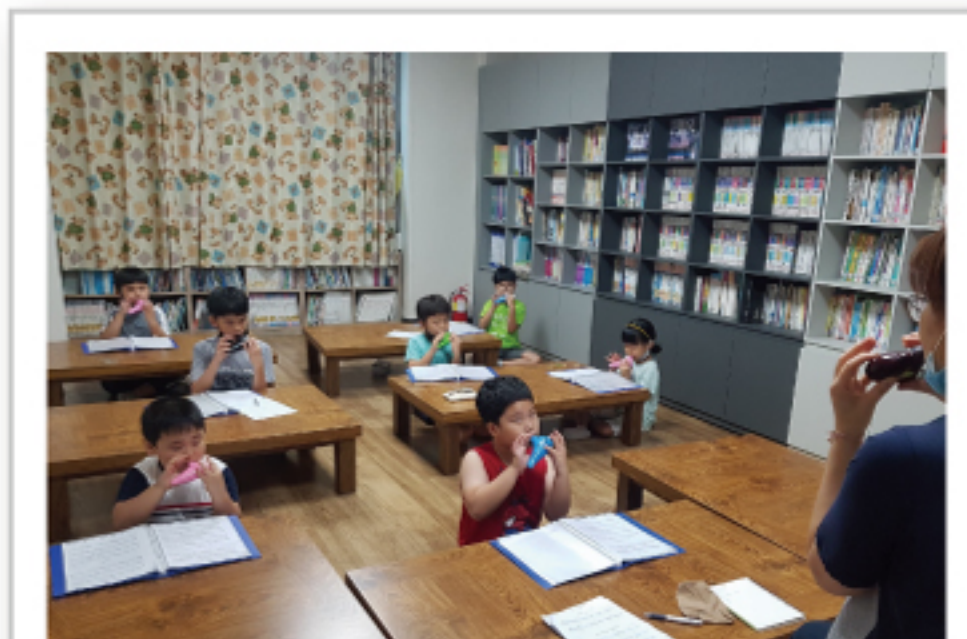
음악교실 - 오카리나연주하기