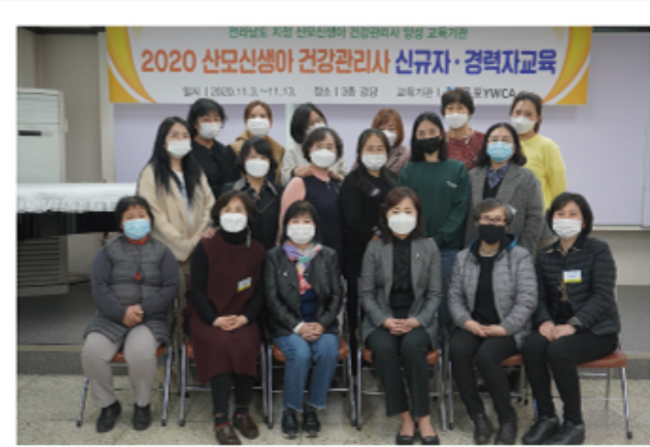
산모신생아 건강관리사 양성교육