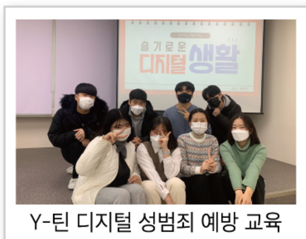
Y-틴 디지털 성범죄 예방 교육