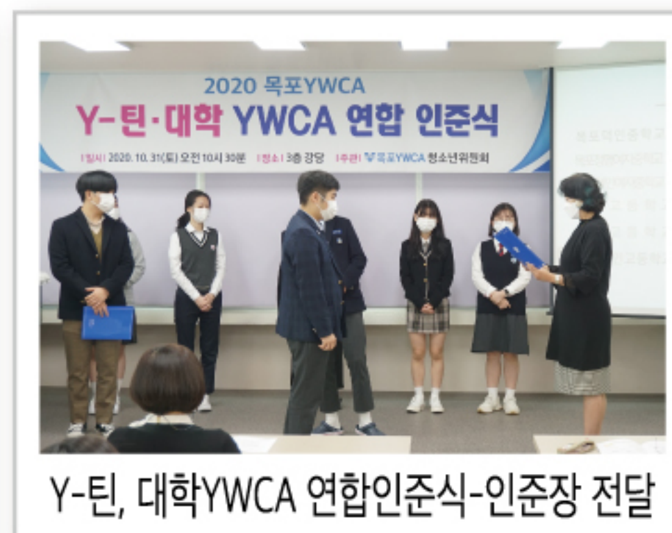
Y-틴, 대학YWCA 연합인준식-인준장 전달