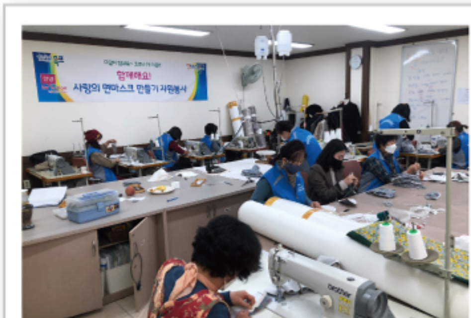
목포시 협업 함께해요! 사랑의 면마스크 만들기