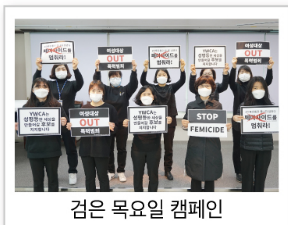
검은 목요일 캠페인