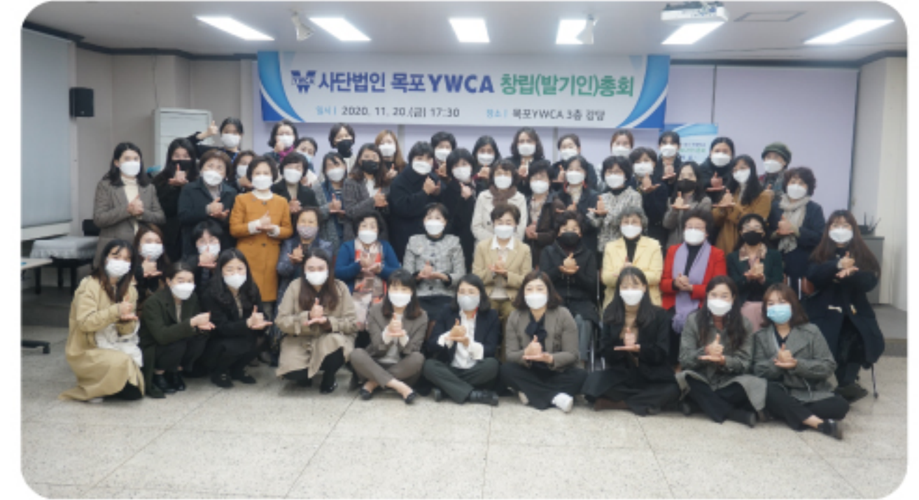
기독교 여성 시민운동체로서 섬김과 나눔을 실천해 나갈 것이다.

예산심의 등 9개 안건을 심의 및 의결함으로써 사단 법인을 출범했다. 1947년 창립후 73년의 긴 역사를 이어온 목포YWCA는 여성들의 지위향상과 권익 보호를 위해 책임있는 시민운동조직으로 성장해 왔으며, 빠르게 변화하는 사회속에서 지역 사회에서 더 책임감을 갖고 변화하는 사회의 요구에 따라 투명 하고, 책임감있는