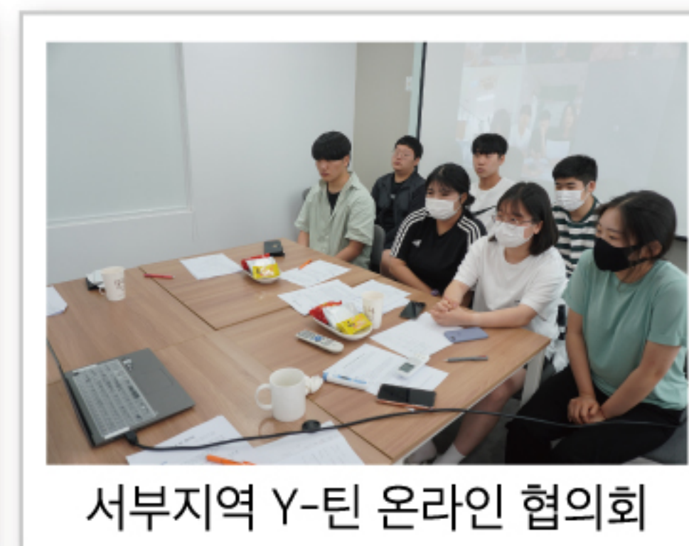
서부지역 Y-틴 온라인 협의회