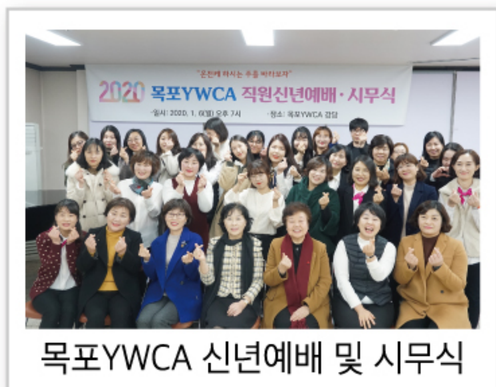
목포YWCA 신년예배 및 시무식