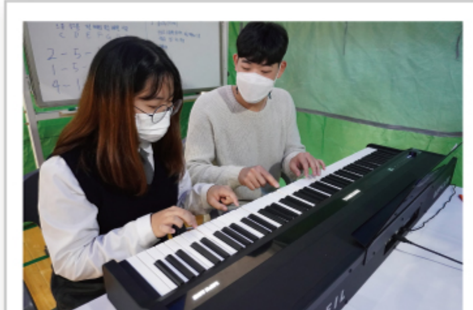
진로페스티벌 - 작곡가 직업체험