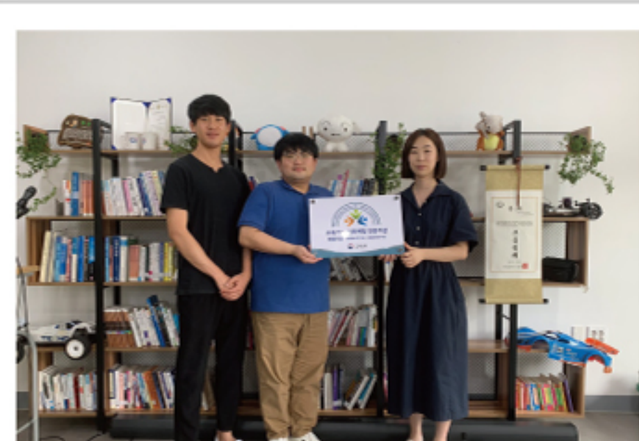
교육기부진로체험인증기관 발굴 - 목포대어울림아카데미