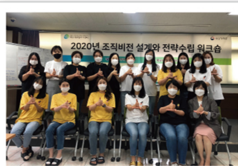
조직비전설계와 전략수립 워크숍