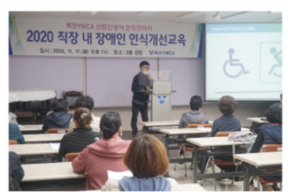
직장 내 장애인 인식개선교육