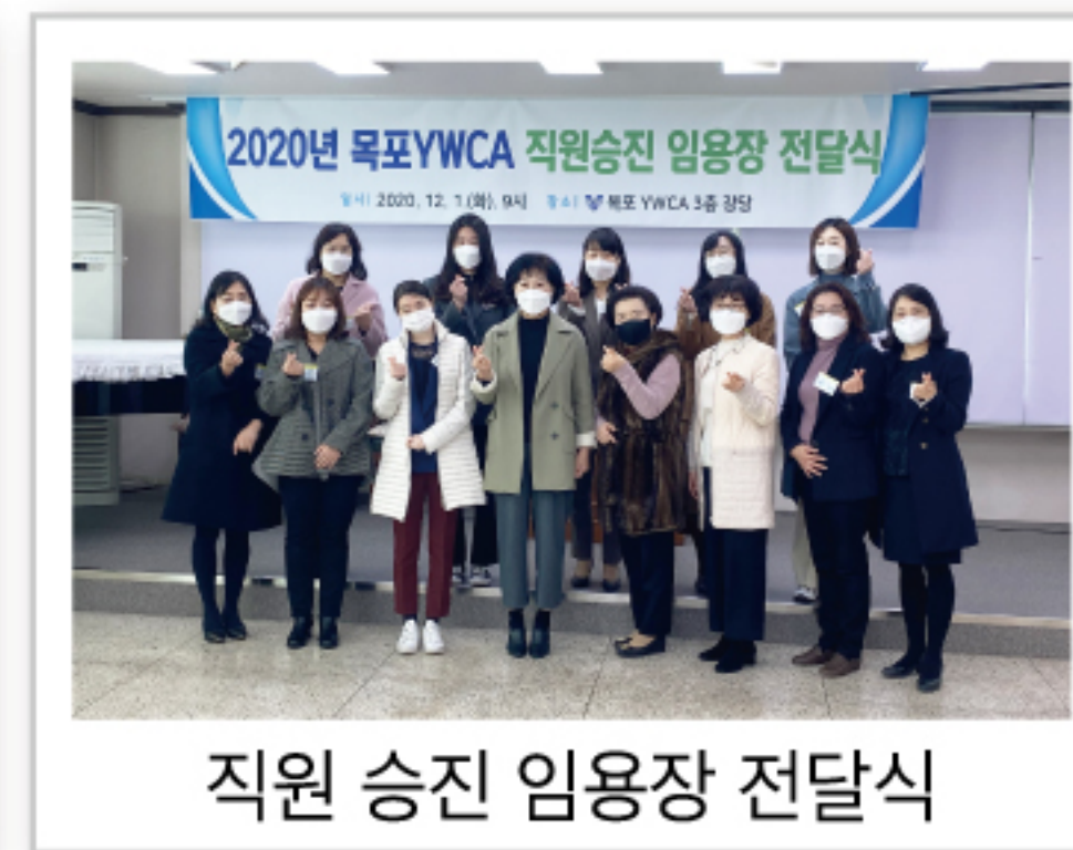
직원 승진 임용장 전달식