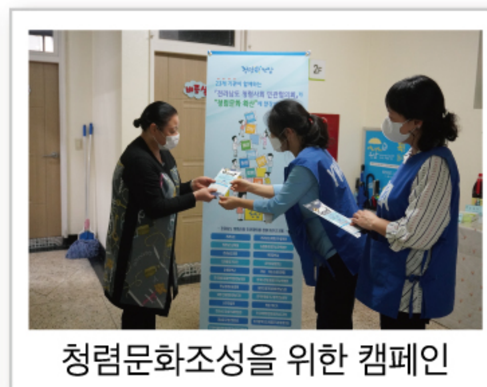
청림문화조성을 위한 캠페인