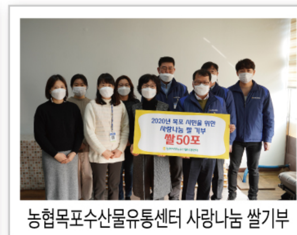
농협목포수산물유통센터 사랑나눔 쌀기부