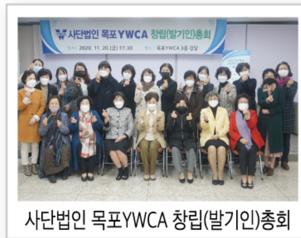
사단법인 목포YWCA 창립(발기인)총회