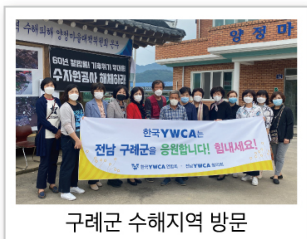
구례군 수해지역 방문