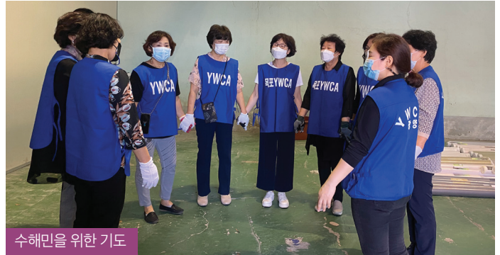
수해민을 위한 기도