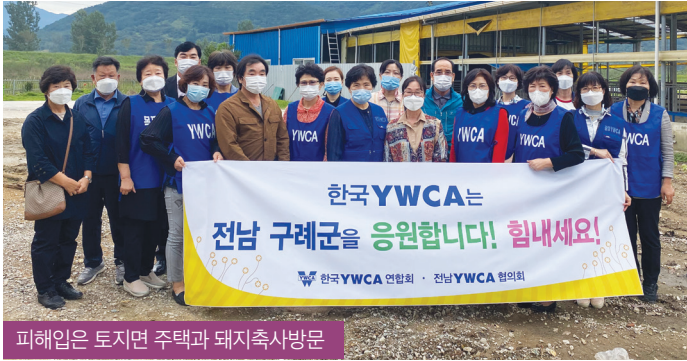
피해입은 토지면 주택과 돼지축사방문