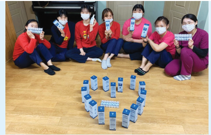
중증장애시설 후원물품 전달 인증샷

코로나19 확산방지를 위한 ‘YWCA 애프터유 캠페인’과 사회적 거리두기 ‘잠시