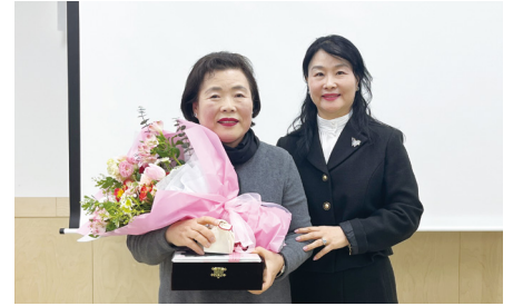
21대 회장 이임 · 22대 회장 취임