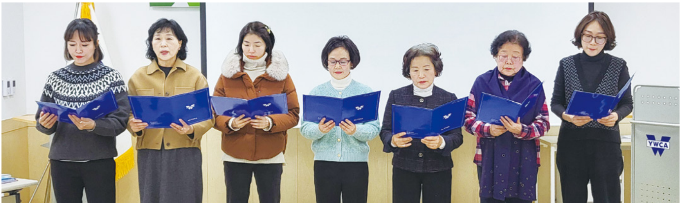
임원, 공천위원 선서