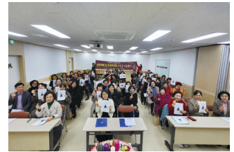
성탄예배 및 추석바자회 수익금 나눔행사