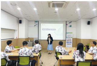
목포여성새로일하기센터 직장문화개선지원 '행복한일터만들기'