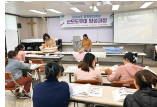
결혼이주여성대상 산모도우미 양성교육 수업