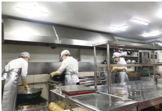
목포시 결식아동급식 밀반찬지원사업