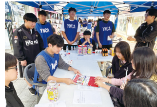
서남권 청소년축제 체험부스 운영