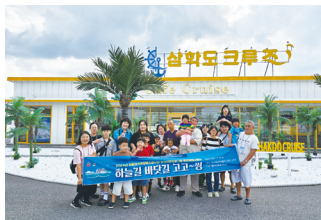
휴식지원프로그램 하늘길바닷길 고고성