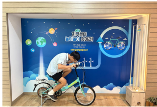
중점운동활동 신재생에너지 체험