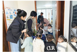
부활절 맞이 경로당 계란 나눔