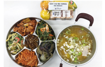
전라남도 서부보훈지청 국가유공자어르신 밀반찬지원사업