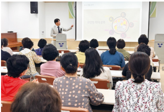
제공인력대상 이용자 및 시설 안전관리교육