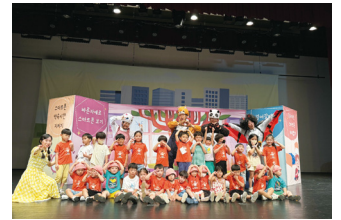
스마트폰 과의존 예방 뮤지컬 견학