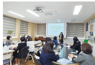
장애아돌보미 활동실무 오리엔테이션