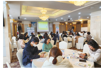
목포여성새로일하기센터 토크콘서트 '만수르'