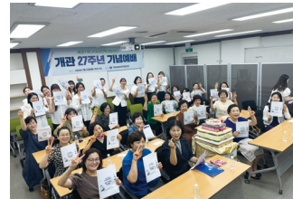
목포여성인력개발센터 개관 27주년 기념예배