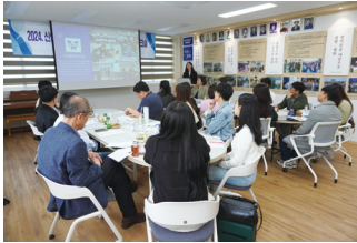
진로 및 자유학기제 교사 워크숍