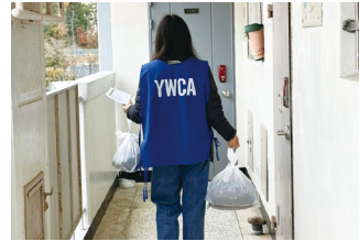
목포시 결식아동급식 부식지원사업