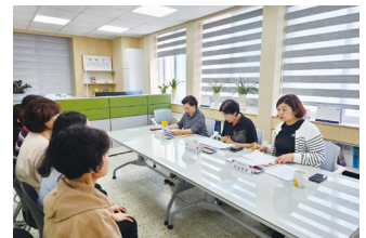
장애아돌보미 양성교육 면접