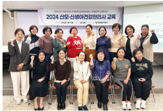
산모신생아 건강관리사양성교육 2024년 3기