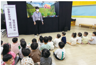
노인 인권 인형극 관람 리멤버사진