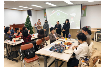
제공인력 연말 월례회