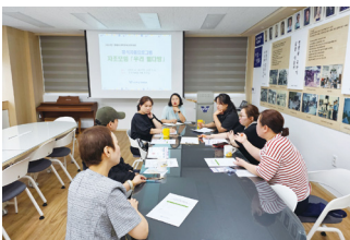
휴식지원프로그램 자조모임[우리 별다방]