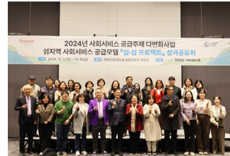
2024년 사회서비스 공급주체 다변화사업 섬지역 사회서비스 공급모델 '섬심 프로젝트' 섬계공유회 섬심프로젝트 성과보고회