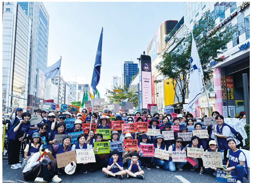
(사)목포YWCA가 9월 7일(토) 전국 동시다발 한국YWCA 기후정의 운동 캠페인에 참여하였다. < 관련기사 2면 >