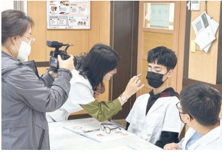
안과 의사 직업 체험 교실