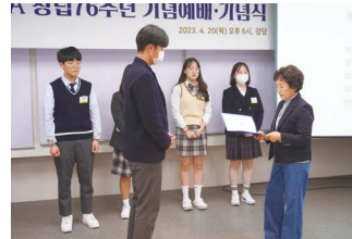
목포YWCA 창립76주년 기념식 - 리더십기금전달