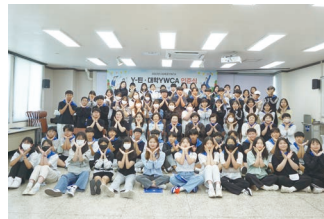
Y-틴, 대학YWCA 인준식