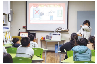
시설 및 이용자 안전관리교육