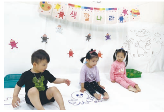
나만의 색깔 찾기 놀이