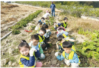
고구마 밭 체험