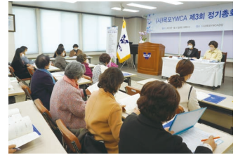
제 3회 정기총회