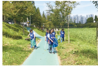
삼향천 일대 플로깅