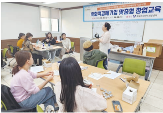
2023년 다문화 사회적경제기업 육성 인큐베이팅 지원사업