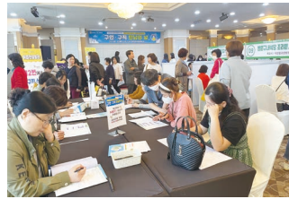
전남형 동행일자리지원사업 구인구직만남의 날