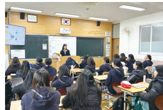
배우고 체험하는 청소년 금융교실 씽크머니