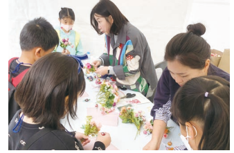
찾아가는 진로 페스티벌 - 플로리스트 직업 체험