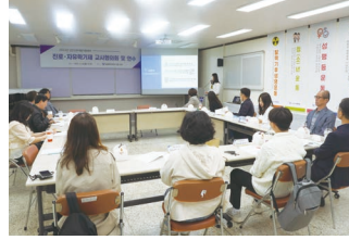
진로, 자유학기제 교사 협의회