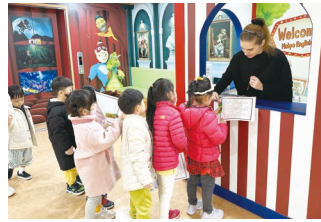
영어 도서관 체험