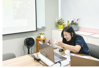
원격 직업 체험 교실 - 조향사 직업 체험