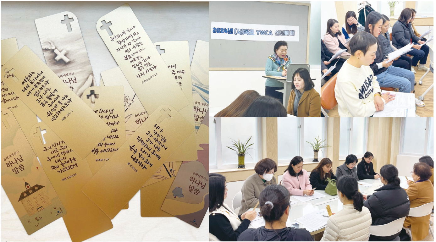
● (사)목포YWCA 이사·직원들이 신년예배를 시작으로 새해 업무를 시작했다. (관련페이지 3페이지)