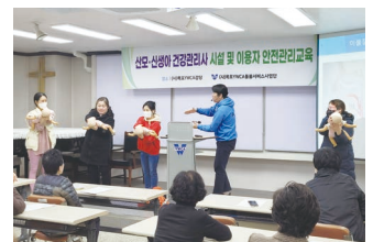
시설 및 이용자안전관리교육