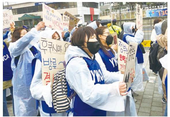
● (사)목포YWCA '후쿠시마 오염수 방류 저지 전국YWCA 긴급 행동'에 참여하였다. (관련기사 4면)