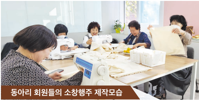
동아리 회원들의 소창행주 제작모습

전 세계에 기후위기로 인한 이상기온과 환경재난 등 급격한 기후변화가 나타나고 있는 지금 현재 (사)목포YWCA는 전국 중점운동인 ‘탈핵기후생명’ 운동정책을 회원들과 적극적으로 전개하고자 ‘기후환경동아리’를 10월 6일(목) 5명의 회원들이 모여 창단하였다. 소창원단 등을 활용한 물품을 제작하여 지역시민 및 목포YWCA회원들에게 배포하여 환경에 대한 중요성을 널리 알리고자 한다.