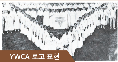
YWCA 로고 표현