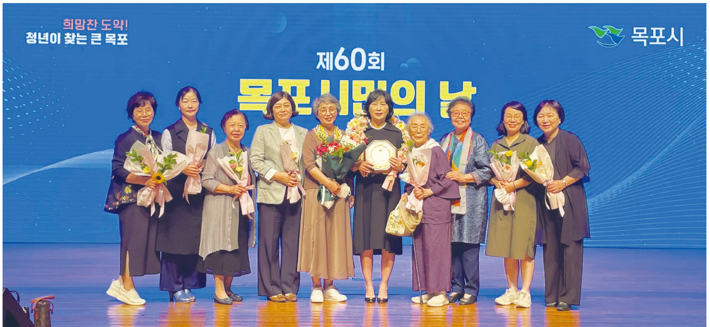
● 제 60회 목포시민의 날 시민의상 특별상 수상 기념으로 기념사진을 찍고 있다 (2,3페이지 계속)