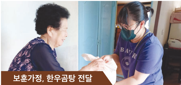
보훈가정, 한우곰탕 전달

(사)목포YWCA는 전국한우협회 주관, 한우자조금관리위원회 주최로 ‘牛리한우~ 소!소!소!’를 진행하였다.