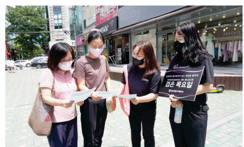
검은목요일 퍼포먼스와 시민대상 홍보