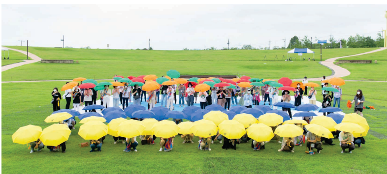
● 우크라이나에 대한 지지와 연대를 나타내며 우크라이나 기 퍼포먼스를 가진 한국YWCA 평화순례단 100인

에서 우산 퍼포먼스를 진행하며 지난 6년간 한반도의 화해와 통일을 염원했던 순례 행사를 마무리했다. YWCA 순례행사는 2022년으로 마무리되었지만 매일의 삶 속에 정의·평화·생명의 순례 길을 걸어가며, 우리의 땅을 평화의 땅으로 변혁해나가고 전쟁과 분쟁, 그리고 갈등으로 황폐화된 땅을 희망과 평화의 복소리로 변화해 나가는 전환점이 될 수 있도록 한국YWCA와 (사)목포YWCA는 평화운동을 지속적으로 펼쳐나갈 것이다.